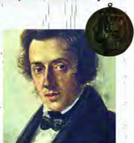
Frédéric Chopin (1810- 1849)

Pianist: Camille Saint-Saëns (1835- 1921) op. 15 Nr.2 Nocturne